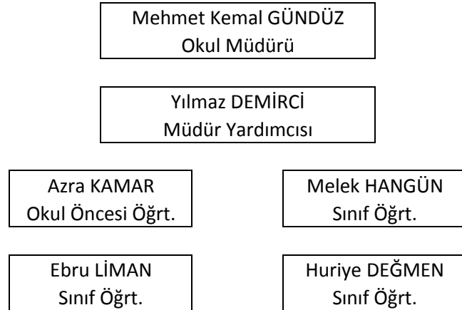
Şekil 1: Organizasyon Şeması